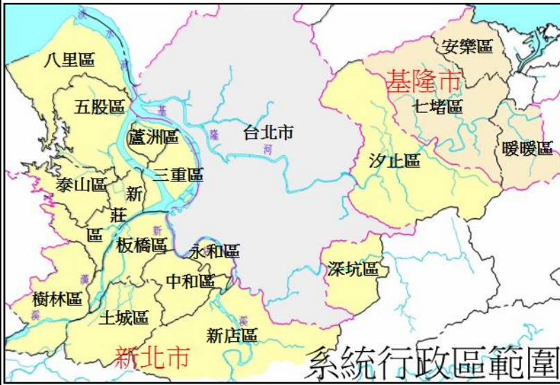
圖 1、淡水河系下水道系統行政區範圍