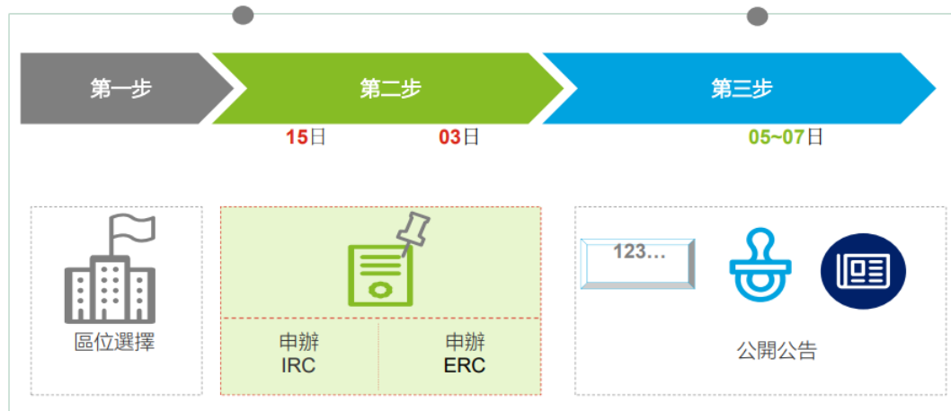
圖 2 註冊成立新公司的作業流程示意