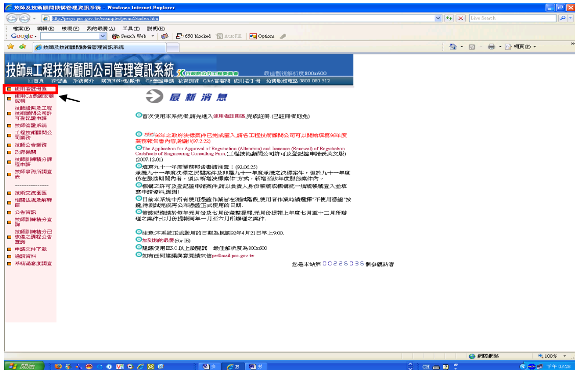
圖 10: 註冊功能