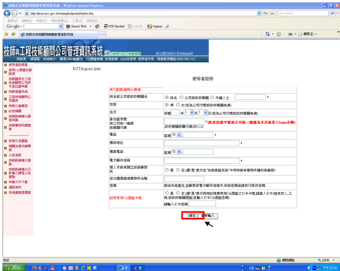
圖 12:使用者資料登錄

3. 於各欄位輸入資料後按[確定]完成註冊，系統處理後以電子郵件將帳號及密碼通知註冊者。(圖 12)