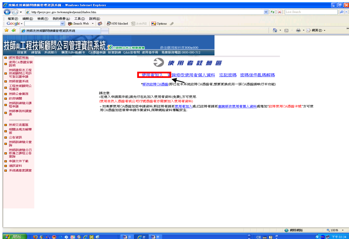
圖 11: 新使用者註冊