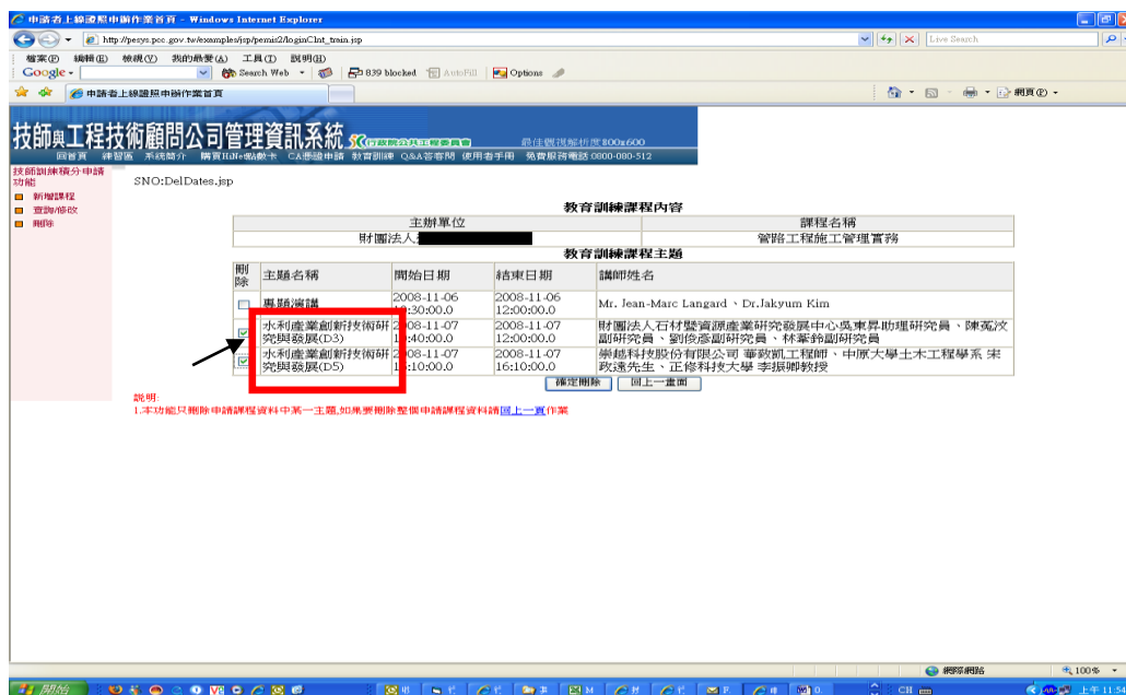
圖 9: 技師訓練積分課程主題刪除列表