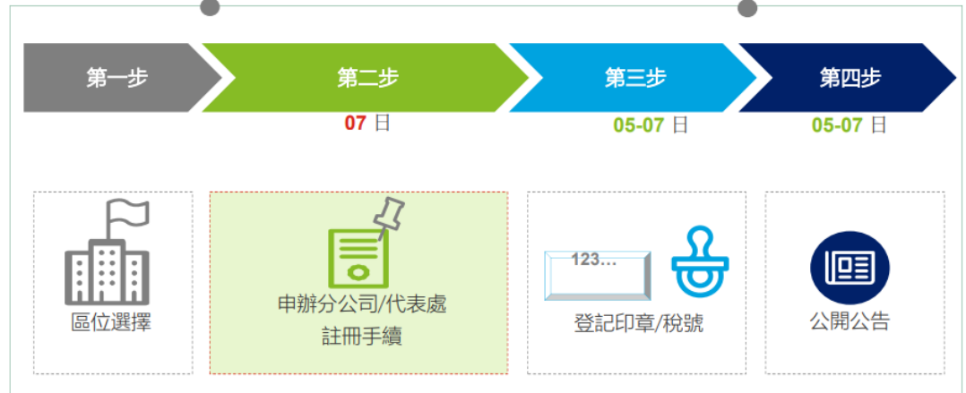
圖 3 註冊成立分公司及代表處作業流程示意