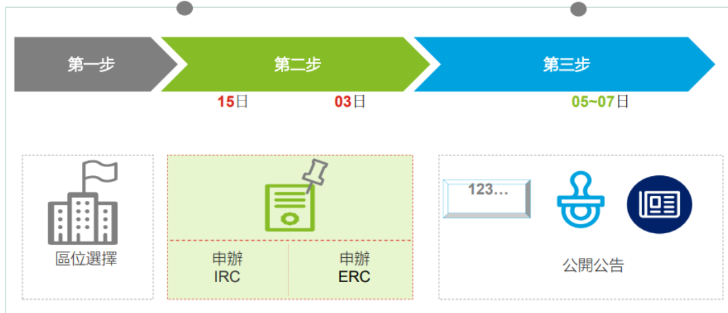
圖 2 註冊成立新公司的作業流程示意