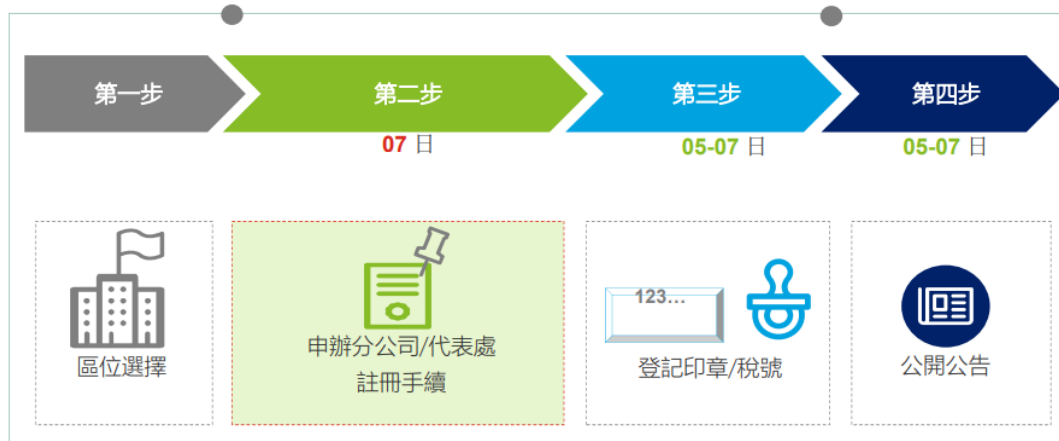
圖 3 註冊成立分公司及代表處作業流程示意