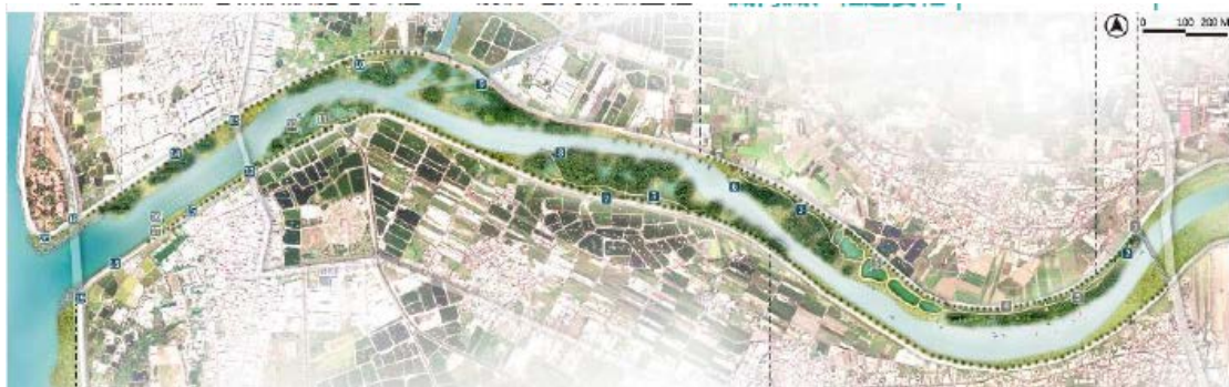
圖 2、流域利用整體討論