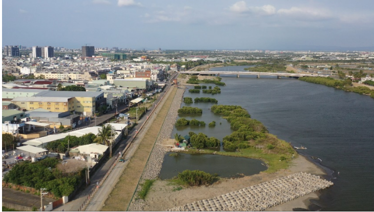
圖 4、生態友善設計及保育措施落實紀錄