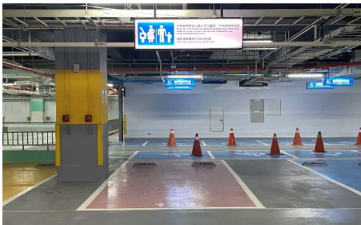
婦幼車位(語音式燈箱)