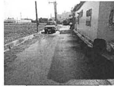
道路路面不潔清理

(1)施工完未將地上泥沙清除，且並未灑水造成塵土飛揚，東北季風將至，有揚塵之疑慮。 ——>