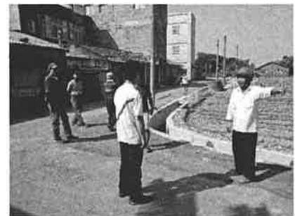
廠商表示為消除農民疑慮此段轉彎處將打除重作並依以地籍圖所示直角方式施作