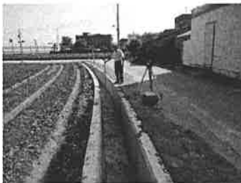
渠底清淤，並全面檢測渠底高程