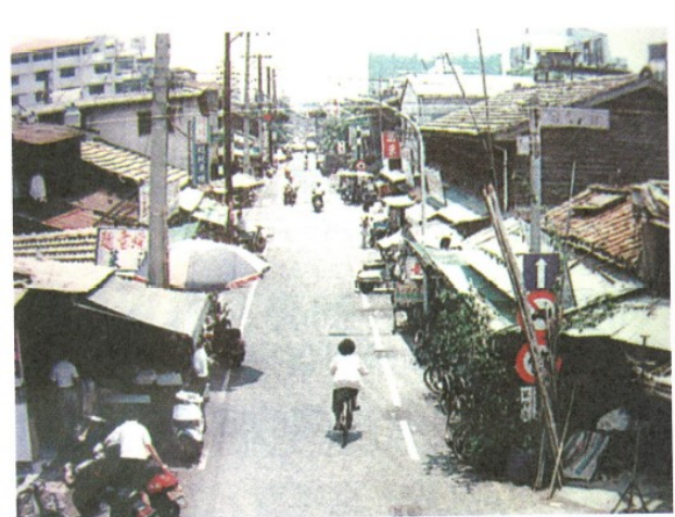
圖 2. 未開挖前海安路街景