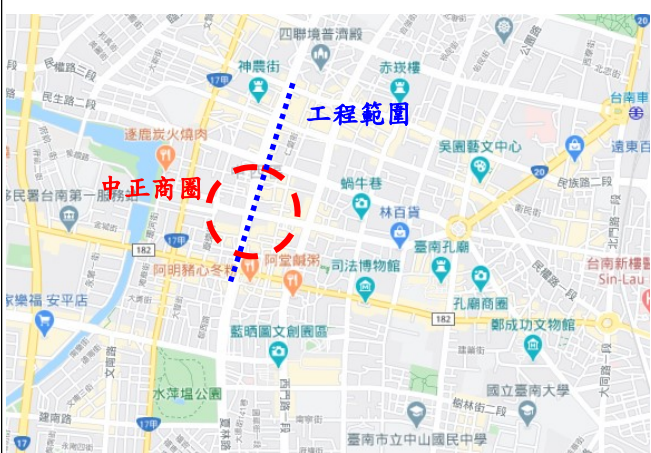
圖 1. 工程位置示意圖