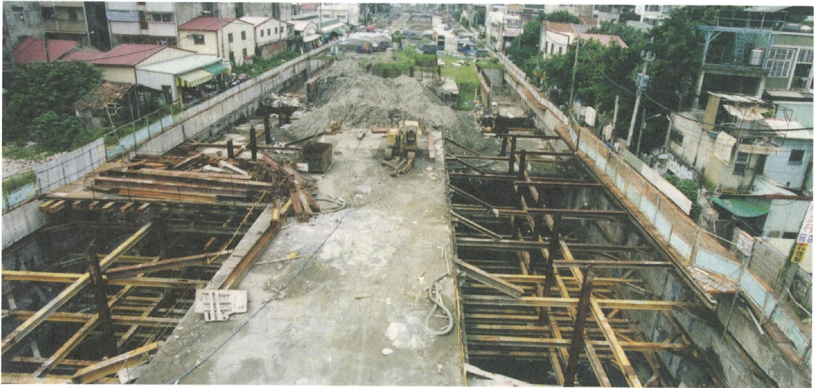
圖 3. 動工近十年仍是一片狼藉