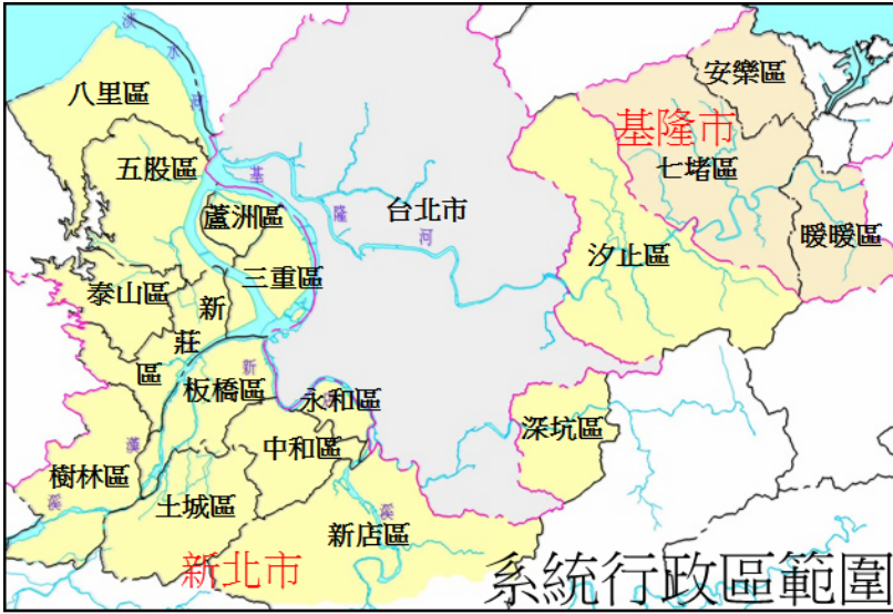
圖 1、淡水河系下水道系統行政區範圍