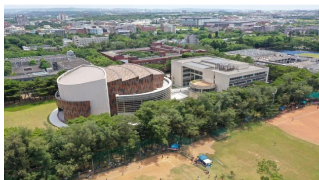
教學研究綜合大樓新建工程