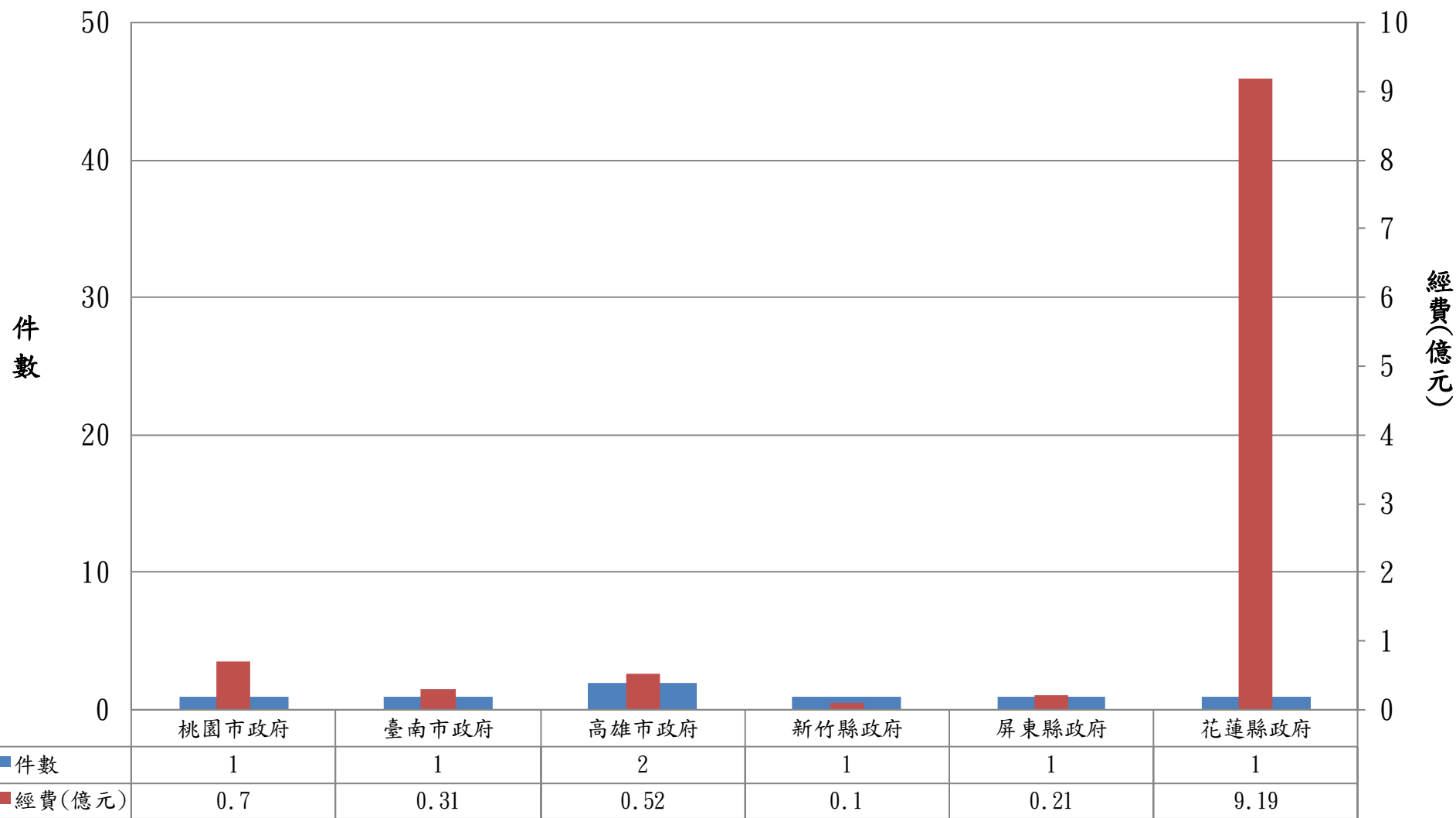
各地方政府閒置公共設施列管情形