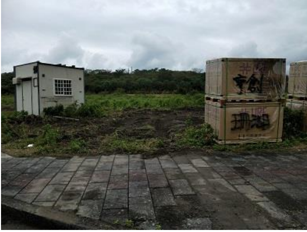
原閒置之工業區土地