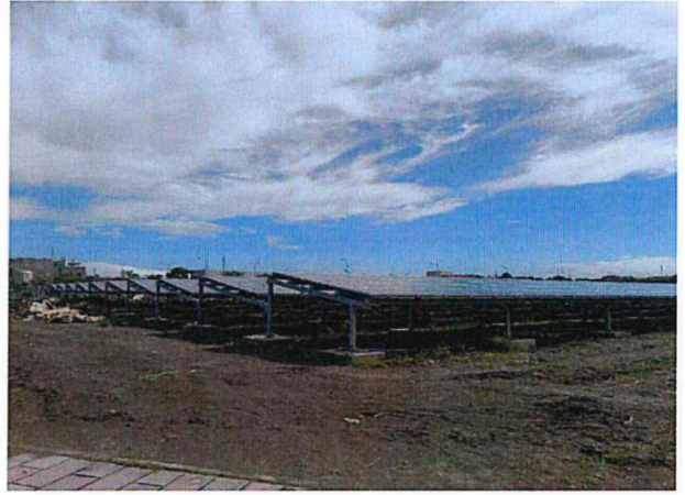
完成建置之太陽能板