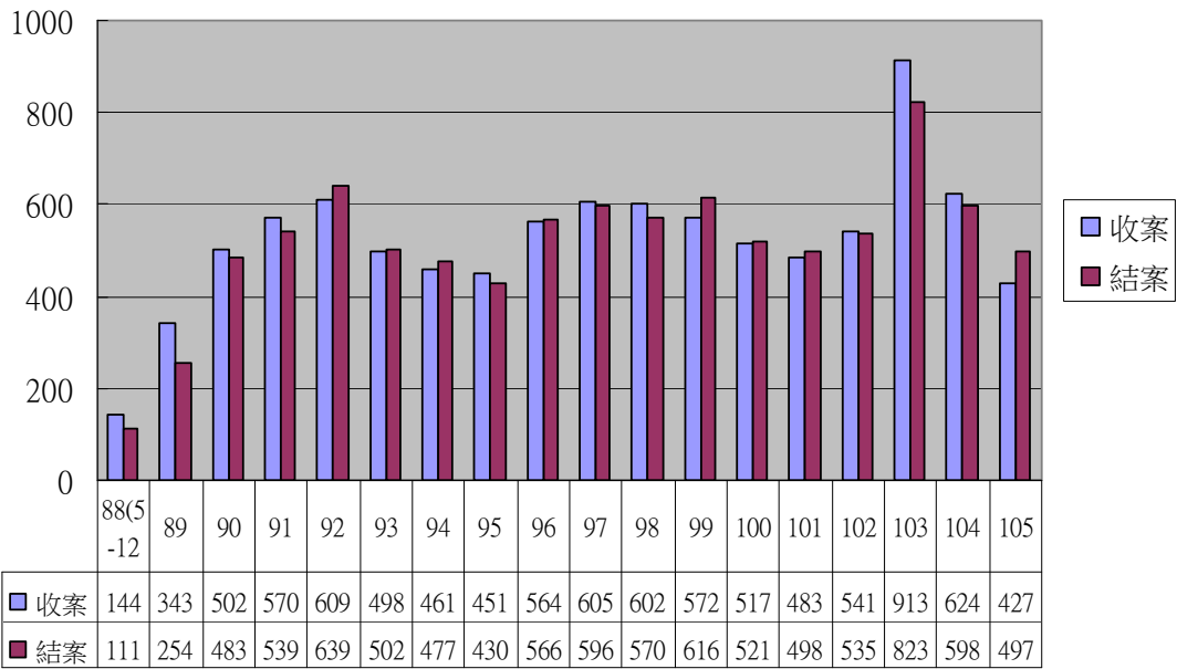
申訴會歷年調解案件收結案統計