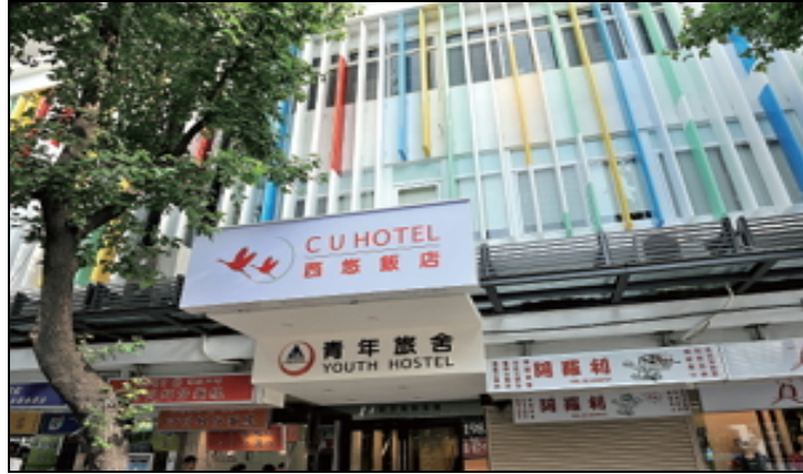
閒置設施活化使用情形