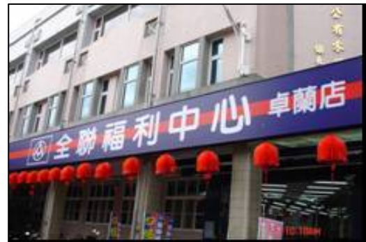
閒置設施活化使用情形