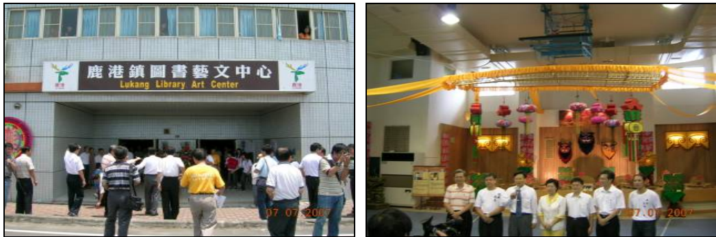
閒置設施活化使用情形

活化措施：「彰化縣役政大樓」轉型為「鹿港鎮圖書藝文中心」：設施原規劃做為役男體檢、抽籤、後備點召等用途，後因兵役法 89 年修正後導致設施閒置，經由文化部（原文建會）、教育部、內政部、彰化縣政府及鹿港鎮公所等機關同仁全力合作下，於 96 年 7 月 7 日起更改大樓名稱為鹿港鎮圖書藝文中心，已成功轉型活化成為一個多功能藝文中心，充分滿足在地民眾藝文展覽、書報雜誌閱讀、社區大學上課學習讀書之需求。