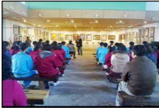
閒置設施活化使用情形