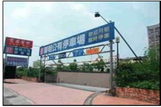
閒置設施活化使用情形