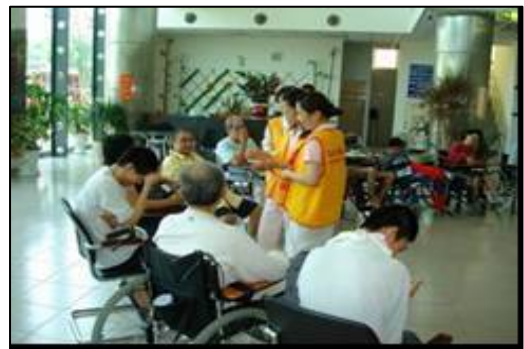
閒置設施活化使用情形