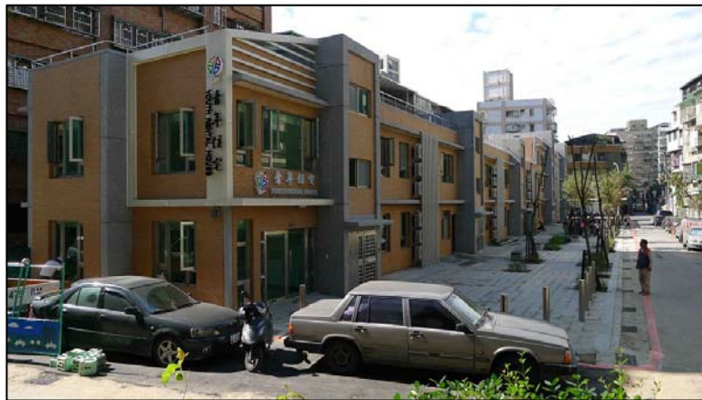
閒置設施活化使用情形

活化措施：原警眷宿舍 22 戶，基地座落於新北市永和區中正路 666 巷內，東側臨中華電信大樓、消防局、警察局。新北市政府規劃共 22 戶住宅單元，其中 9 戶做為警察備勤室、2 戶做為公共空間，11 戶做為出租住宅(其中 2 戶做為無障礙青年使用)，全案已於 102 年 3 月 28 日辦理入住儀式。